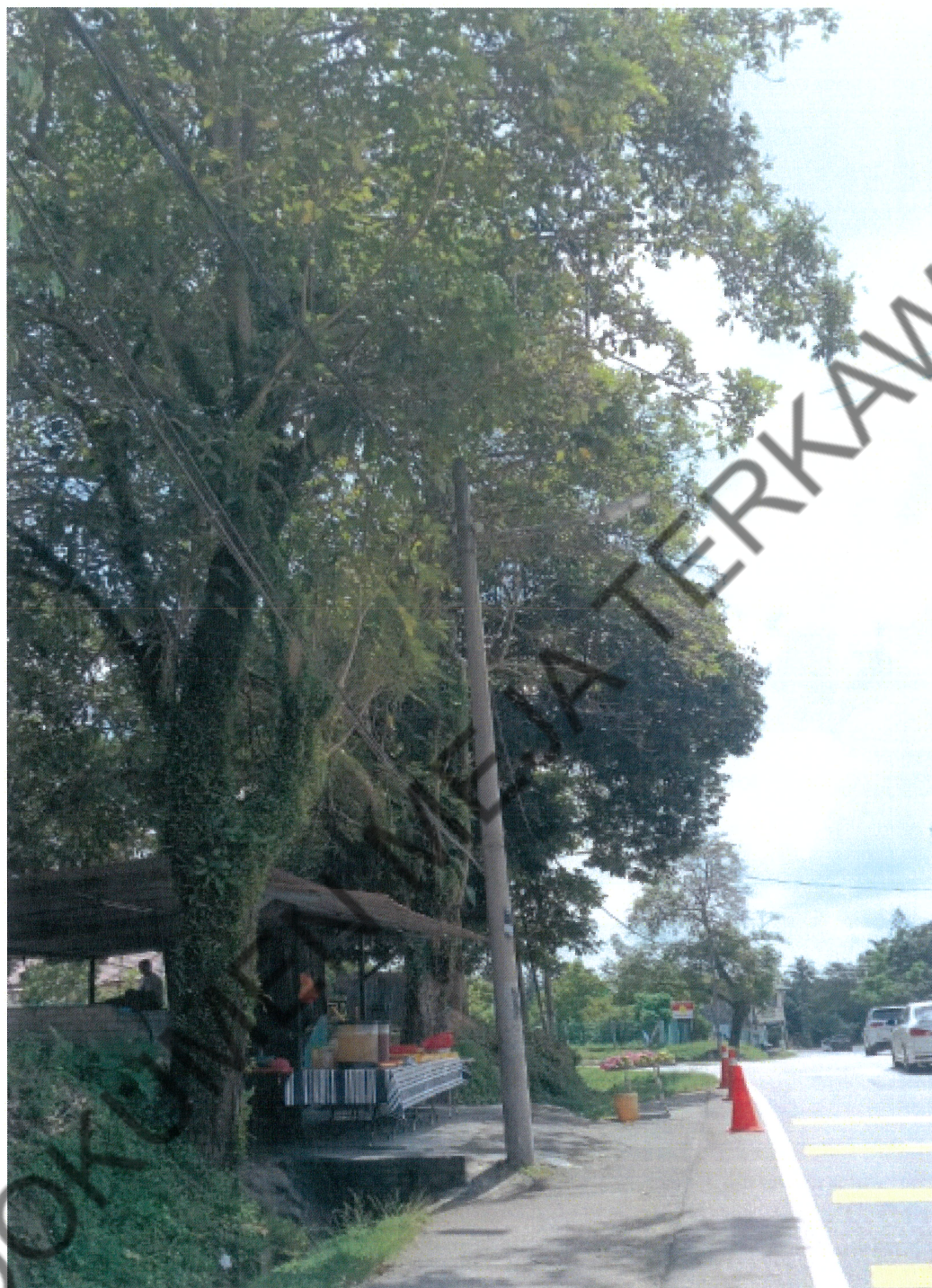
ANTARA 33 BTG POKOK TEKOMA YANG PERLU DITEBANG KERANA BERPOTENSI MEMBAHAYAKAN KESELAMATAN ORANG AWAM