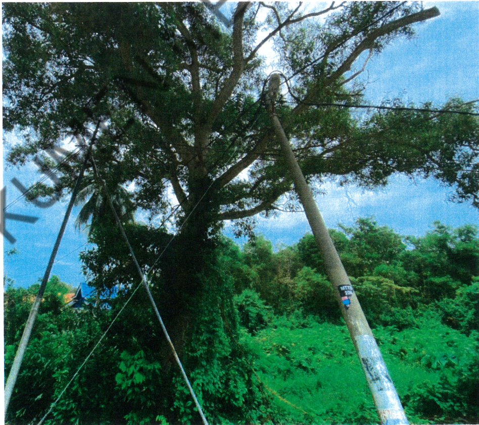
1 BTG POKOK AKASIA YANG PERLU DITEBANG KERANA BERPOTENSI MEMBAHAYAKAN KESELAMATAN ORANG AWAM