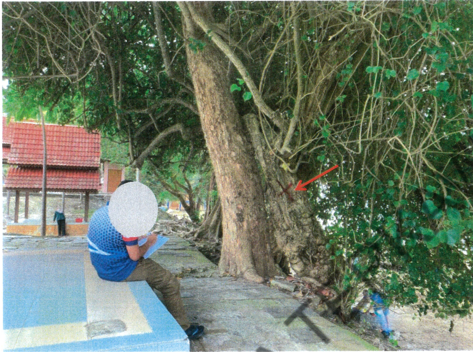
1 BTG POKOK JAMBU LAUT YANG PERLU DITEBANG KERANA BERPOTENSI MEMBAHAYAKAN KESELAMATAN ORANG AWAM