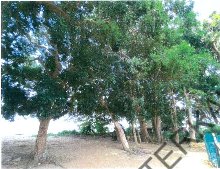
10 BTG POKOK KHAYA YANG PERLU DITEBANG KERANA BERPOTENSI MEMBAHAYAKAN KESELAMATAN ORANG AWAM