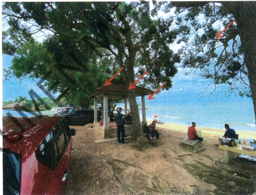
4 BTG POKOK KHAYA YANG PERLU DITEBANG KERANA BERPOTENSI MEMBAHAYAKAN KESELAMATAN ORANG AWAM